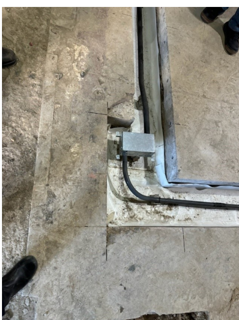
Installation of conduit for floor boxes for power and data.