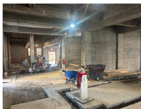
View from the Children's Area towards the Community Room with the staircase just beyond the blue wheelbarrow.